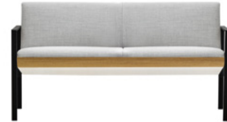
— 2 seater sofa with wooden shell Sofá 2 plazas con carcasa de madera