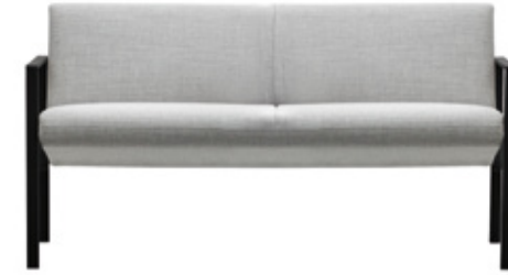
— 2 seater sofa Sofá 2 plazas