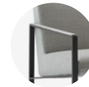
— Arm with upholstered armpad Brazo con reposabrazos tapizado