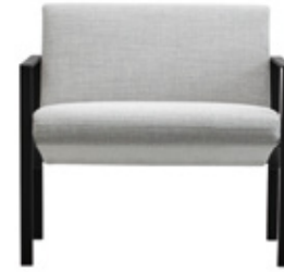
— Armchair Sillón