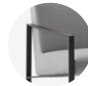
— Standard arm Brazo estándar