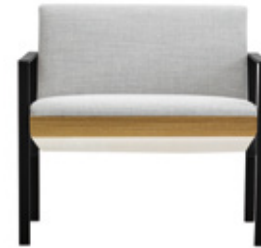
— Armchair with wooden shell Sillón con carcasa de madera